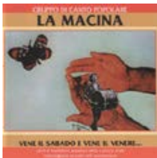
Copertina LP Vene il sabado e vene il venero..., 1982

Per i quaranta anni dello storico primo disco de La Macina