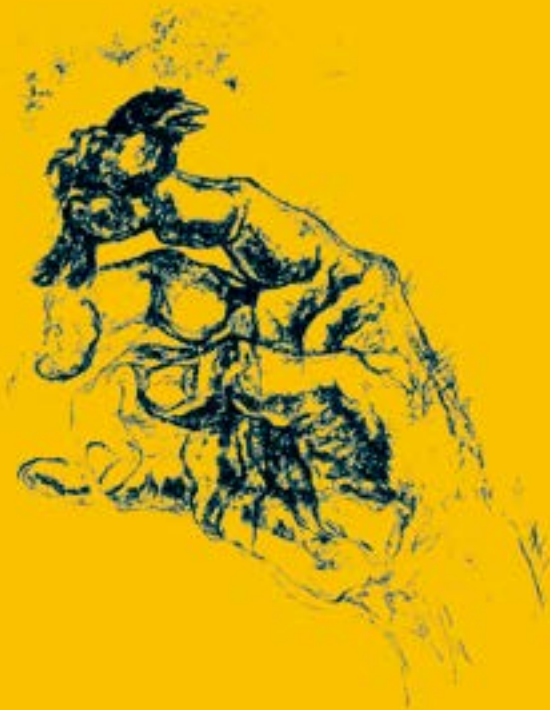
WALTER PIACESI. "Il passero solitario" (incisione/particolare)