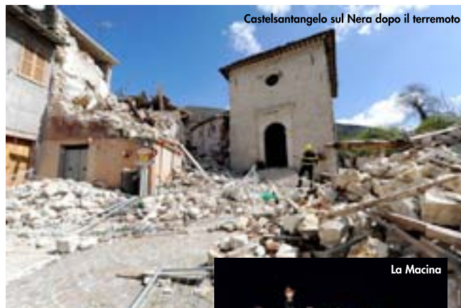
Castelsantangelo sul Nera dopo il terremoto