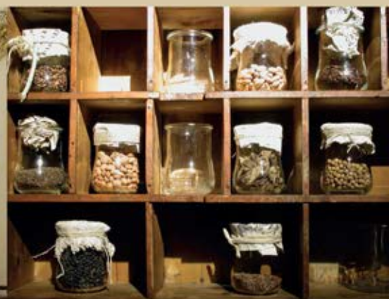
Semi provenienti dal Monastero di S. Maria Maddalena, presenti presso il Museo delle Arti Monastiche.