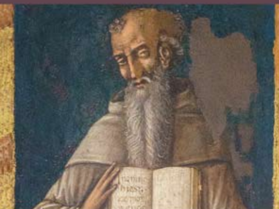
Pala (Sec. XV) ritraente il Beato Gherardo, patrono di Serra de' Conti, conservata presso la Chiesa S. Maria de Abbatissis.