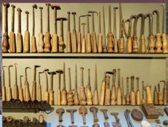
Utensili per lavorazioni artigianali praticate nel Monastero di Santa Maria Maddalena, esposti presso il Museo.