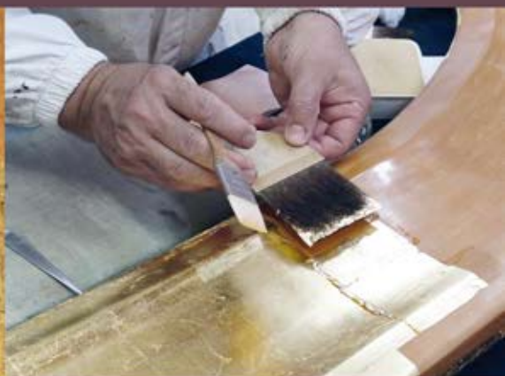
Tecnica della doratura del legno.