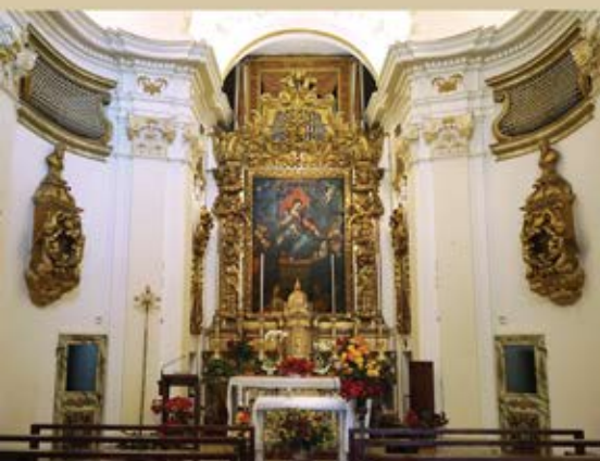
Chiesa di Santa Maria Maddalena - Interno (Sec. XVI-XVIII)