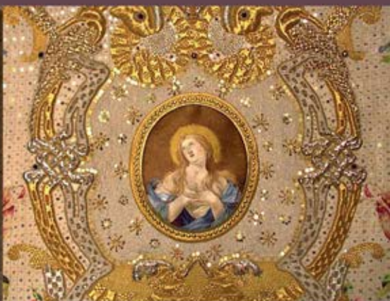
Ricamo del pallotto ritraente S. Maria Maddalena, opera realizzata dalle Monache del Monastero a lei intitolato.