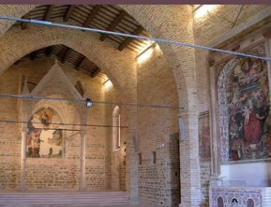
Chiesa di San Michele Arcangelo - Interno (Sec. XIII)