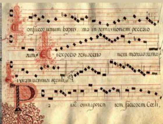
Spartito musicale presente nell'Archivio del Monastero di Santa Maddalena.