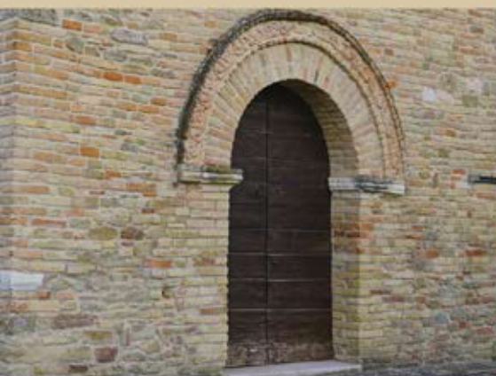
Chiesa rurale di San Fortunato - Portale